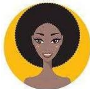
② Imagem de frente