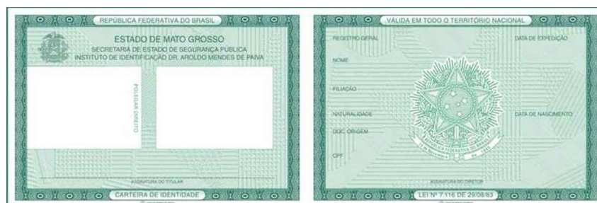
① Imagem frente e verso do Documento de Identificação

FOTOS DO DOCUMENTO DE IDENTIFICAÇÃO: Digitalize o Documento de Identificação (pdf, jpg, bmp ou png), dentre os considerados válidos conforme Edital de convocação. A digitalização deve contempla a frente e o verso do documento. Se necessário pode enviar dois arquivos, sendo um com a frente e o outro com o verso.