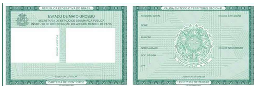
① Imagem frente e verso do Documento de Identificação

FOTOS DO DOCUMENTO DE IDENTIFICAÇÃO: Digitalize o Documento de Identificação (pdf, jpg, bmp ou png), dentre os considerados válidos conforme Edital de convocação. A digitalização deve contempla a frente e o verso do documento. Se necessário pode enviar dois arquivos, sendo um com a frente e o outro com o verso.