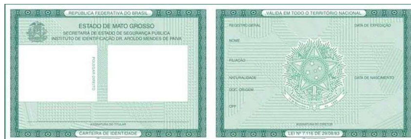
① Imagem frente e verso do Documento de Identificação

FOTOS DO DOCUMENTO DE IDENTIFICAÇÃO: Digitalize o Documento de Identificação (pdf, jpg, bmp ou png), dentre os considerados válidos conforme Edital de convocação. A digitalização deve contempla a frente e o verso do documento. Se necessário pode enviar dois arquivos, sendo um com a frente e o outro com o verso.