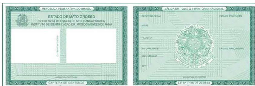
① Imagem frente e verso do Documento de Identificação

FOTOS DO DOCUMENTO DE IDENTIFICAÇÃO: Digitalize o Documento de Identificação (pdf, jpg, bmp ou png), dentre os considerados válidos conforme Edital de convocação. A digitalização deve contempla a frente e o verso do documento. Se necessário pode enviar dois arquivos, sendo um com a frente e o outro com o verso.