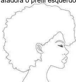
① Imagem do perfil direito

FOTOS: Os arquivos de fotos deverão sempre enquadrar da altura um pouco acima da cabeça até a cintura do(a) candidato(a) e ser, atual/recente, individual e ter no máximo tamanho por arquivo, conforme indicado no edital de convocação. ① A primeira foto deverá ser fotografado/a o perfil direito do(a) candidato(a). ② A segunda foto deverá ser fotografado(a) o(a) candida(a) de frente. ③ E por fim, a terceira, fotografado/a o perfil esquerdo do(a) candidato(a).