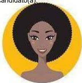
② Imagem de frente