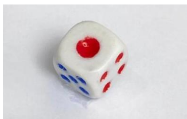
Figura 3.2: Dado utilizado para a realização do jogo.

O dado utilizado para o jogo “Uma Aventura Energética” é um dado típico (padrão) com seis faces, numeradas de 1 a 6, como mostrado na Figura 3.2. Ele serve para determinar o número de cada que cada dupla deve avançar no tabuleiro.