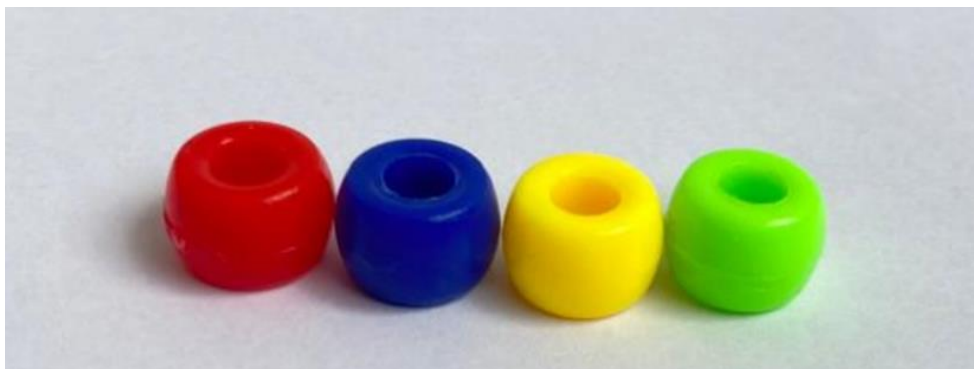
Figura 3.1: Pinos “Miçangas” nas cores dos reinos do tabuleiro.

Contudo, os pinos também podem ser feitos utilizando uma impressora 3D, visto que muitas escolas já possuem esse tipo de equipamento.